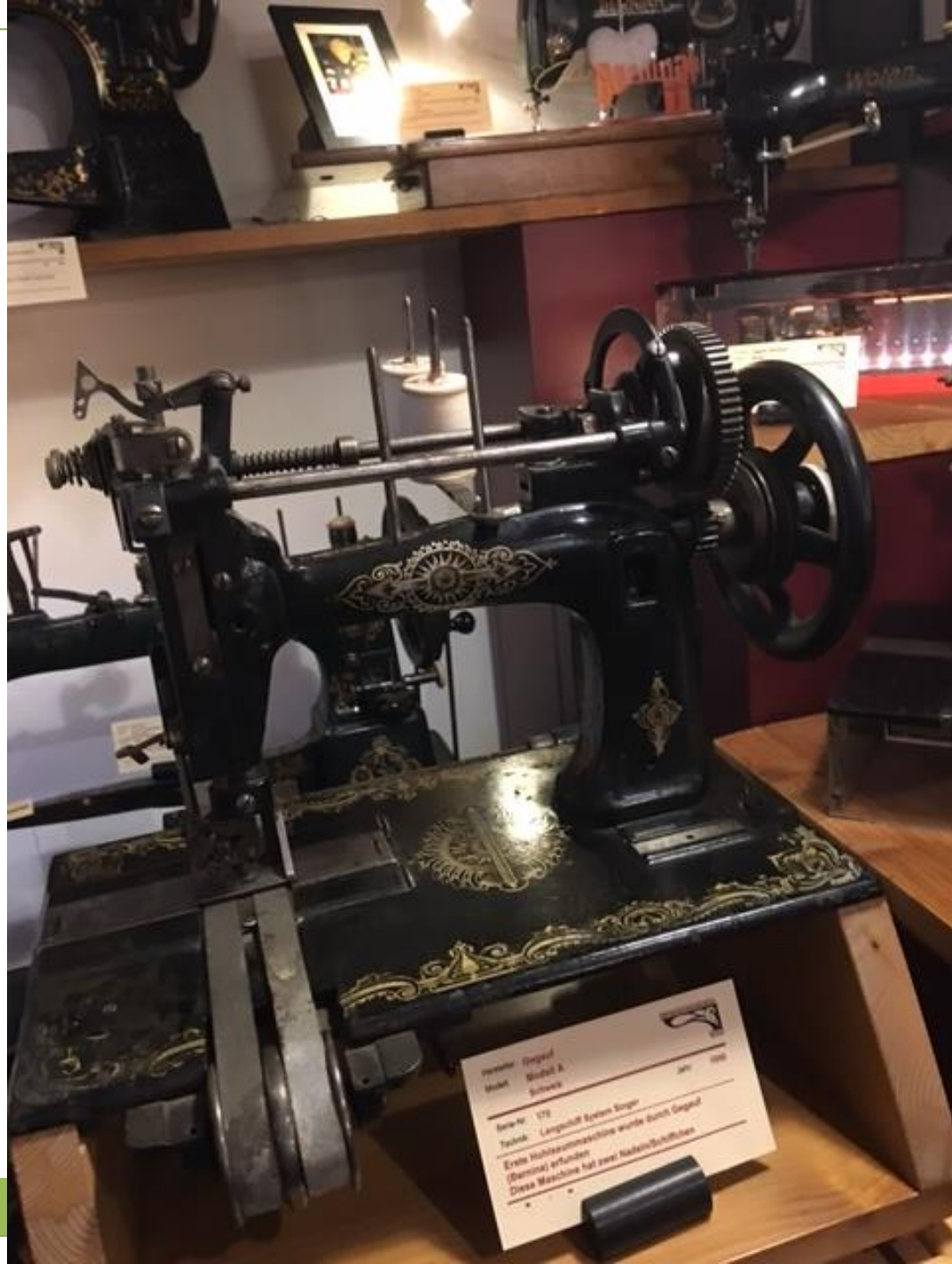
Hersteller: Gagel Modell: Model A Schwarz Serien-Nr.: 172 Technik: Langstichmaschine wurde durch Gagel Erste Hochdruckmaschine wurde durch Gagel Diese Maschine hat zwei Nadeln/Schiffchen